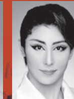
登堂結斗 (ブトレマイオス13世)

カエサルの愛人にしてブルータスの姉。カエサルに純愛を捧げるが、クレオパトラの存在に翻弄され続け、愛憎の炎にその身を焦がす。