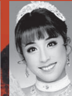
千咲えみ (セルウィリア)

カエサルに最も愛された側近であり、セルウィリアの弟。共和制の父ルキウス・ブルータスの末裔であり、反カエサルである元老院との狭間で苦悩する。