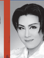
緋波亜紀 (ポンペイウス)

姉クレオパトラと共にエジプトを統治するファラオ。己の野心に目覚め、クーデターを起こし、クレオパトラを王宮から追放する。