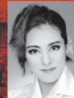
翼和希 (ブルータス)

英雄カエサルの側近中の側近であり、心の内を全て知り、武力も兼ね備えた頼もしい盟友。知略に優れた将であり、カエサル快進撃の立役者となる。