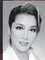
愛瀬光 (アントニウス)

エジプト最後のファラオ。弟との権力争いの末、王宮を追い出されるが、内に秘めた強さと美貌を武器に、カエサルとともに王位奪還を目指す。